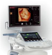
(超高清妇产超声诊断仪)