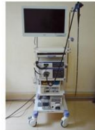
(奥林巴斯290电子胃肠镜系统)